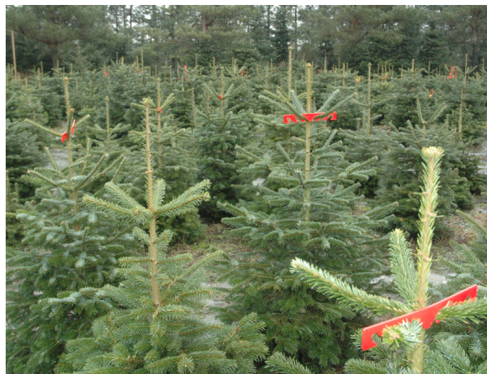
Grenrettere er et effektivt værktøj til at få symmetri i juletræerne, og Dansk Skovudstyr har nu udviklet en billig variant af høj kvalitet

- Vi er helt overbeviste om behovet, der er jo tale om en vare, som i forvejen forbruges i